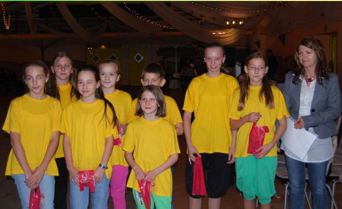
Uczniowie ze SP w Malanowie-zwycięzcy w kat. taniec dowolny

Projekt dofinansowany przez Gminę Malanów.