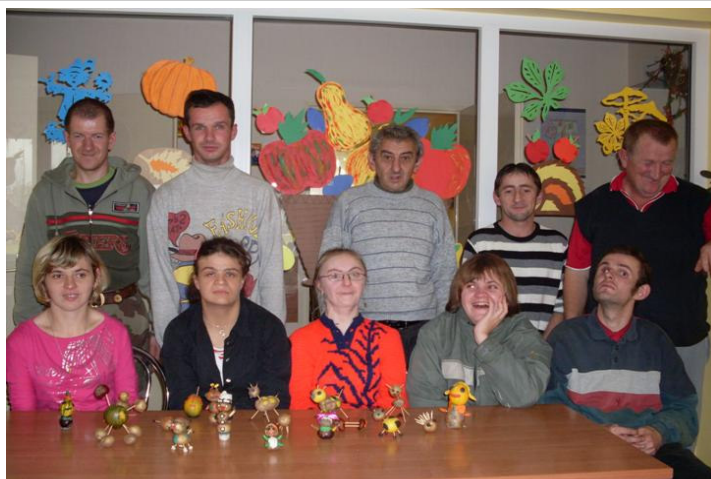
Uczestnicy SDŚ-u w pracowni artystyczno-plastycznej

Ziemniak, wraz z jesiennymi darami natury, posłużył do stworzenia różnych, wymyślonych przez