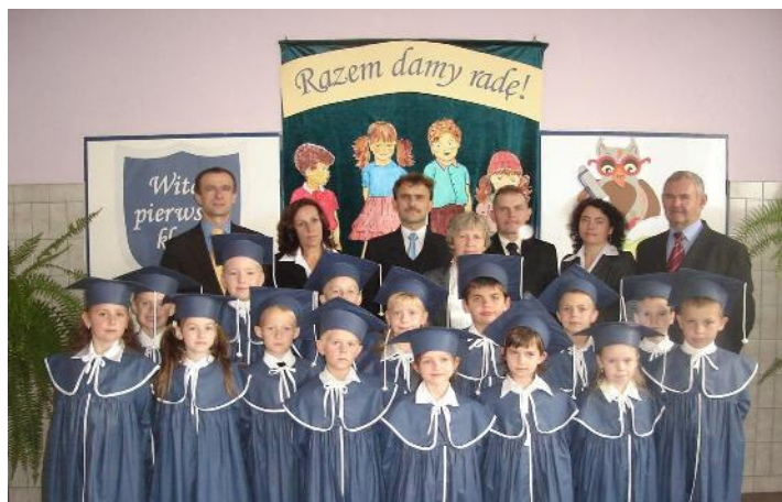
Pierwszoklasiści ze SP w Miłaczewie