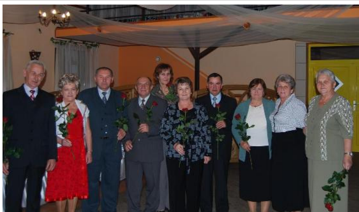
Nowi członkowie stowarzyszenia powitani zostali kwiatami