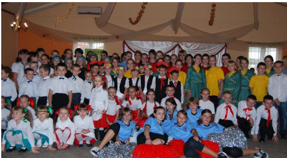
Uczestnicy II Międzyszkolnego Turnieju Tańca

W przerwie prezentacji konkursowych i podczas obrad jury umiejętności taneczne zaprezentowały dzieci z Gminnego Przedszkola w Malano-