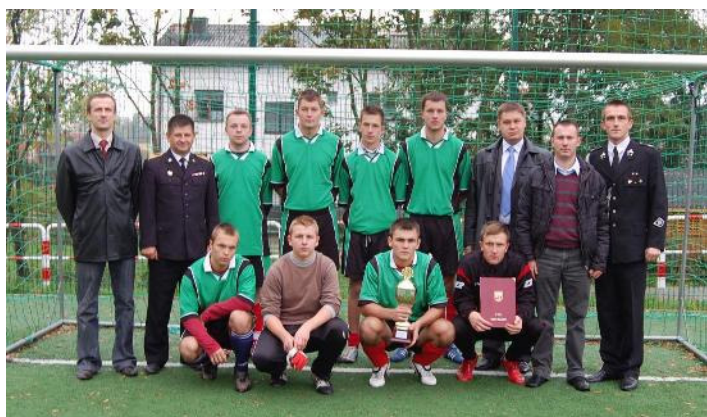
Drużyna OSP Kotwasice zwycięzcy turnieju

D nia 17 października na kompleksie sportowo-rekreacyjnym „ORLIK” w Malanowie rozegrano I Gminny Turniej Drużyn OSP w Piłce Nożnej. Założeniem turnieju była integracja członków OSP z naszej gminy oraz wyłonienie najlepszej drużyny, która będzie reprezentowała gminę w powiatowym turnieju piłki halowej w 2010 r.