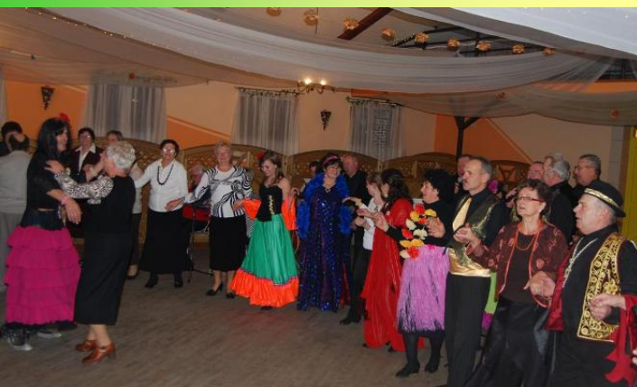
Wspólna zabawa z zespołem Niechcice

i śpiewem oddającym charakter dawnych obyczajów. Wspólna zabawa dopełniła świetności spotkania. Wielokierunkowe działania podejmowane przez Stowarzyszenie „Nadzieja”, szczególnie zaś adresowane do ludzi starszych i niepełnosprawnych, wzrost liczby członków oraz pobudzanie aktywności społecznej dowodzą, że statutowe zadania stowarzyszenia są prawidłowo realizowane.