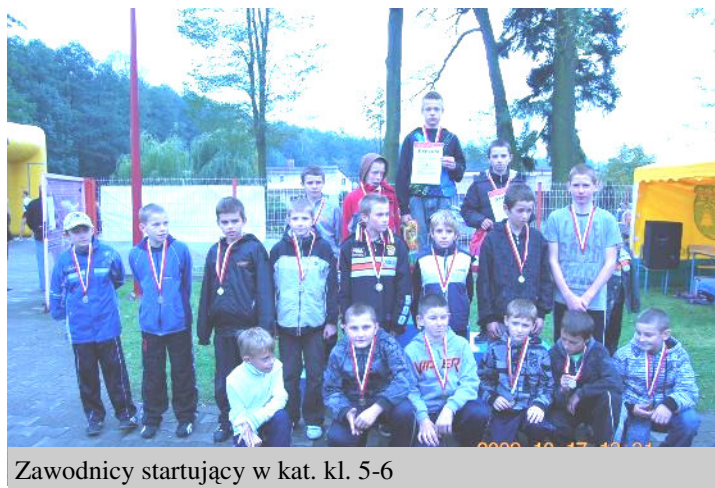
Zawodnicy startujący w kat. kl. 5-6