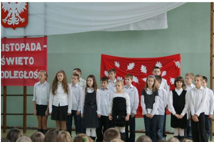
Podczas uroczystej akademii

W historii powszechnej dzień 11 listopada 1918 r. zapisał się przede wszystkim jako data zakończenia I wojny światowej. Dla Polaków jednak 11 listopada to symboliczna data - Święto Odzyskania Niepodległości przez Polskę. Po 123 latach niewoli, rozbiorów, obcego panowania, w końcu 1918 roku odrodziło się państwo polskie.